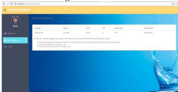
Gambar 4.2 Hasil desain tampilan web

Gambar 4.2 merupakan salah satu hasil implementasi tampilan system monitoring pada web. Pada Web monitoring ini terdapat beberapa halaman yaitu halaman home, halaman monitoring real time , serta halaman history .